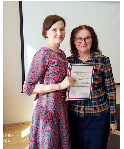
Награждение победителя конкурса

Анализируя уровень профсоюзного членства среди молодых работников, участники заседания отметили, что единой тенденции по увеличению или уменьшению профчленства среди молодежи нет. В целом по областной организации за 2021 год профсоюзное членство среди молодых работников сократилось на 2,4%. Такие показатели во многом связаны с уменьшением числа членов профсоюза в возрасте до 35 лет в первичной профсоюзной организации ПАО «Ярославский радиозавод». Но есть и другие примеры активной и плодотворной работы профсоюзного актива. Например, профсоюзное членство среди молодых работников конструкторского бюро «Луч» увеличилось на 8,2% с уровня 2020 года и перешагнуло пятидесятипроцентный рубеж.