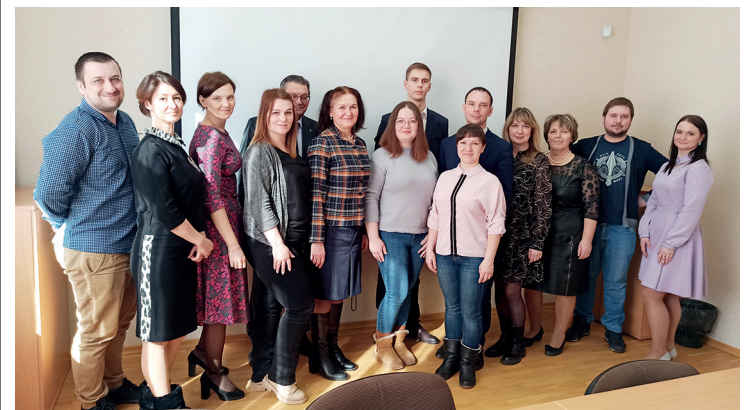
Участники выездного заседания

16 марта Областной совет Профрадиоэлектрон провёл выездное заседание в Рыбинске. В этот раз его участниками стали также члены Молодежной комиссии. Вместе с профсоюзными лидерами они провели анализ профсоюзного членства, наметили план работы на текущий год, обсудили событийный календарь Профрадиоэлектрон.