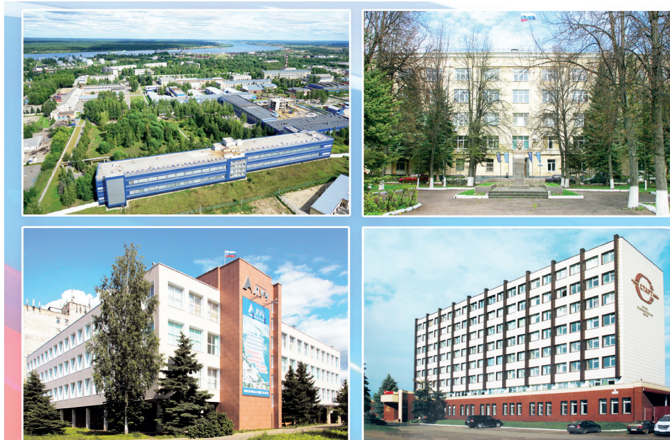
В настоящее время в областную организацию входят 6 первичных профсоюзных организаций, объединяющих 2 337 человек. 90% членов Профсоюза стоят на учете в четырех первичных профсоюзных организациях

За пройденный период областная организация находилась в разных ситуациях – это были тяжелые 90-е годы, годы становления